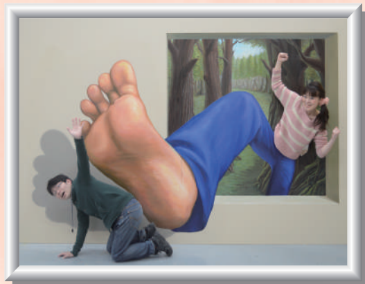
右足が大きくなっちゃった