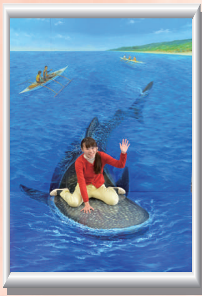
ジンベイザメの背に乗って