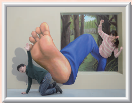
右足が大きくなっちゃった